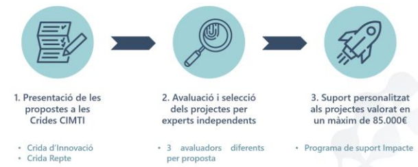
Figura 1: Fases del model de funcionament del CIMTI.

Per tal d'assolir els seus objectius, el CIMTI es basa en el model de funcionament (Figura 1.) que consisteix en la publicació de crides per a que les persones innovadores que vulguin optar a gaudir dels serveis del CIMTI puguin presentar les seves propostes . Les propostes són avaluades per un comitè d'experts independents tenint en consideració els criteris d'elegibilitat fixats pel CIMTI. Finalment, els projectes més ben valorats són seleccionats per a passar a la fase de suport del CIMTI .